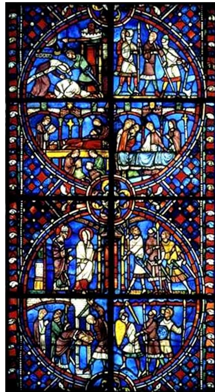
Saint Nicaise, martyr / Cathédrale de Reims.

Abbé L. Jaud, Vie des Saints pour tous les jours de l'année , Tours, Mame, 1950.