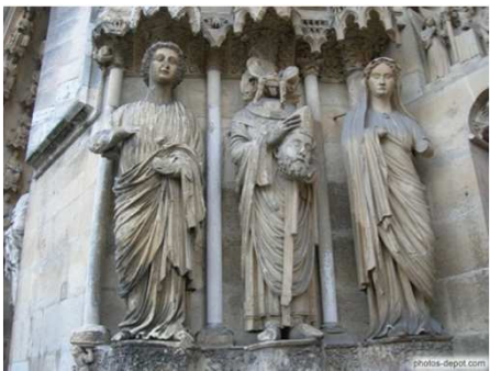
"PORTAIL DES SAINT" (v. 1220 - 1230) Cathédrale de Reims.

Saint Nicaise portant sa tête, accompagné de sa sœur Sainte Eutropie et d'un ange à l'encensoir.