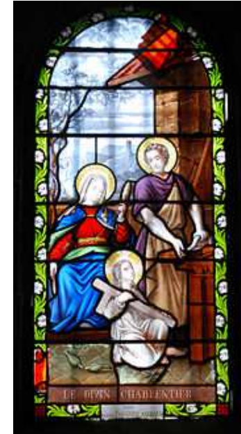
Sainte Famille : vitrail le "Divin charpentier" dans l'église de la Godivelle village dans le Puy-de-Dôme

Ô Père adoptif du Christ, ne méprisez pas mes prières, mais écoutez-les favorablement et daignez les exaucer. Amen.