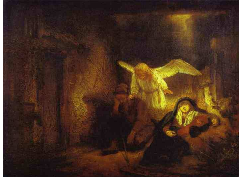
Rembrandt. Le Songe de St. Joseph. 1645. Huile sur panneau. Gemäldegalerie, Berlin, Allemagne.