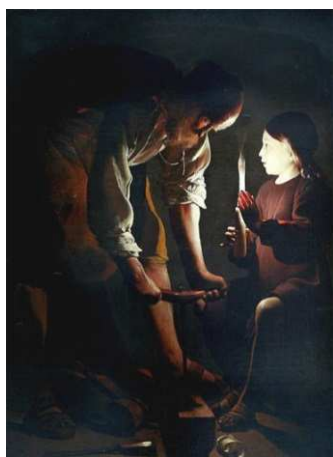
SAINT JOSEPH CHARPENTIER, Georges de La Tour (Vers 1640) Huile sur toile Dimension 137 x 101 cm Musée du Louvre, Paris (effet artistique et méditation sont recherchés dans le clair-obscur)