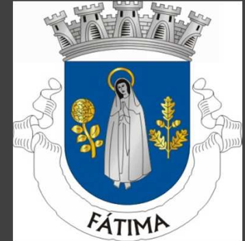
Notre Dame de Fátima sur le blason de la ville

Le 13 octobre 1917, il pleut à torrent sur la Cova da Iria, et une foule d'environ 50 000 personnes récite le chapelet. À midi, heure solaire, l'apparition se présente alors à Lucie comme étant Notre-Dame du Rosaire et lui demande de faire bâtir une chapelle en son honneur. Elle annonce la fin proche de la guerre. Elle demande aussi la conversion des pécheurs. Alors que Notre-Dame du Rosaire s'élève vers le ciel, la pluie s'arrête et le soleil revient dans un ciel bleu. Les témoins peuvent regarder le soleil directement, ils le voient se mettre à tourner sur lui-même, lançant des faisceaux de lumière de différentes couleurs. Le soleil paraît même s'approcher de la terre, inquiétant la foule. Puis après dix minutes, tout redevient normal. Pendant ces phénomènes cosmiques, les enfants voient quant à eux les trois apparitions promises : la Sainte Famille, puis Notre-Dame des Sept-Douleurs accompagnée du Christ et enfin Notre-Dame du Mont-Carmel.