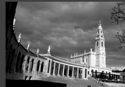
Basilique Notre-Dame-de-Fatima, l'esplanade