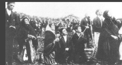
Copie photostatique d'une page de l'édition du 29 octobre 1917 du Ilustração Portuguesa , montrant la foule regardant le « miracle du soleil » durant les apparitions à Fátima,